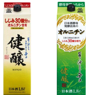
(旧デザイン) (新デザイン)

当商品は、2020年発売。オリジナル酵母研究の末、日本酒が本来持つ味わいはそのままに、醸造由来のオルニチン1合(180ml)あたり、しじみ30個分相当を含有した日本酒です。飲酒とともにオルニチンを美味しく手軽に摂取できる、嗜好性と機能性を兼ね備えた“健康系清酒”です。